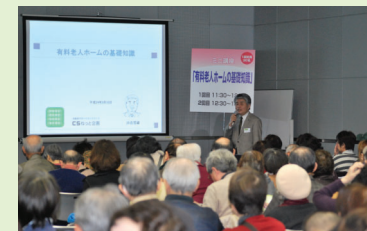
会場では様々な情報を手に入れるチャンス

高齢者住宅に精通するパネリストが、複雑化している高齢者住宅の現状、住み選びのポイント等を徹底討論!