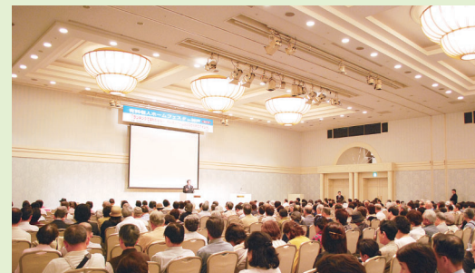
前回のステージイベントの様子

高齢者住宅に精通するパネリストが、複雑化している高齢者住宅の現状、住み選びのポイント等を徹底討論!